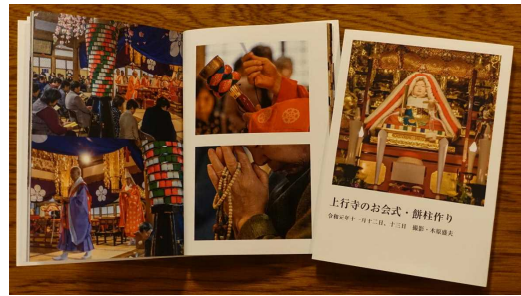
「お会式」写真集文庫サイズです。 写真・木原盛夫