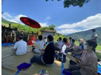
7月19日青空の下で【富山重忠公供養祭】