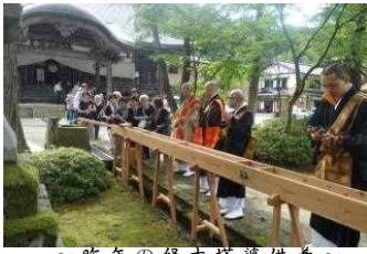
～ 昨年の経木塔婆供養～

暑さ厳しき折、皆さま方におかれましてはいかがお過ごしでしょうか。さて、来る八月二十三日に『孟蘭盆・川施餓鬼会』を執り行います。孟蘭盆会は、ご先祖様並びに法界萬靈の精霊が、餓鬼道に落ちないよう百味の御喰を御供養しご先祖の遺徳に感謝を捧げる行事です。まだまだコロナ禍の中ではありますが万全を期した上で、共にお題目を唱え、ご先祖への感謝の法要をおつとめしましょう。