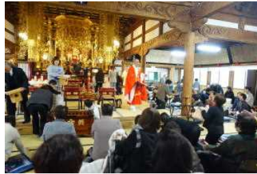
1月26日お日待・節分会【豆撒き】

お日待節分会は、例年通り行いましたが、三月涅槃会より新型コロナウイルス感染拡大により、すべての行事は、縮小して行われました。寺総代役員・佛教婦人会の皆さまにご協力いただき行事を行うことができました。誠に有り難うございました。