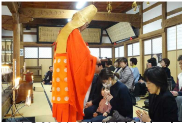
1月26日お日待・節分会【厄払い】

暑さ厳しき折、皆さま方におかれましてはいかがお過ごしでしょうか。さて、来る八月二十三日に『孟蘭盆・川施餓鬼会』を執り行います。孟蘭盆会は、ご先祖様並びに法界萬靈の精霊が、餓鬼道に落ちないよう百味の御喰を御供養しご先祖の遺徳に感謝を捧げる行事です。まだまだコロナ禍の中ではありますが万全を期した上で、共にお題目を唱え、ご先祖への感謝の法要をおつとめしましょう。