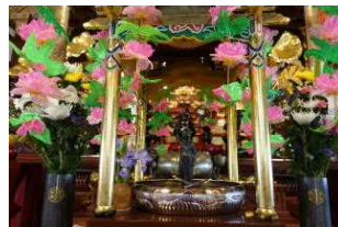
5月8日【降誕会】住職のみでお勤め