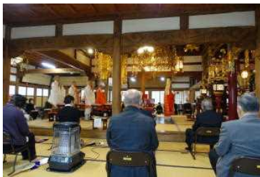
4月3日【祠堂法要】新祠堂に附いていただいた方にお出向いただきました。